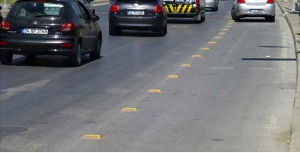
Yıpranan kırmızı işaretler

Sorun Bisiklet yolunun araç şeritlerinden çizgilerle ayrıldığı bir adanın bulunması ve bisiklet yolunun başladığı yeri net bir şekilde belirten yol çivililerinin kırmızı bir şerit üzerine yerleştirilmesi doğru ve güvenli bir çözümdür. Fakat bazı yerlerde işaretler tamamen aşınmıştır ve araç sürücüleri bisiklet yolunu ayırt etmekte zorlanmaktadır.