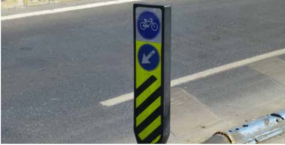
Bisiklet yolunun başlangıcında kafa karıştırıcı işaret

Sorun Kavşaklardan sonra üzerinde bir bisiklet işareti bulunan plastik bir tabela ile zorunlu yön işareti yerleştirilmiştir. Bu işaret bisiklet kullanıcılarının işaretin sol tarafından gitmeleri gerektiği şeklinde anlaşılabilir.