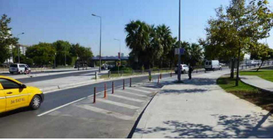
Bisiklet kullanıcıları bisiklet yoluna girmek için yere işaretlenen ada üzerinden geçmek durumunda