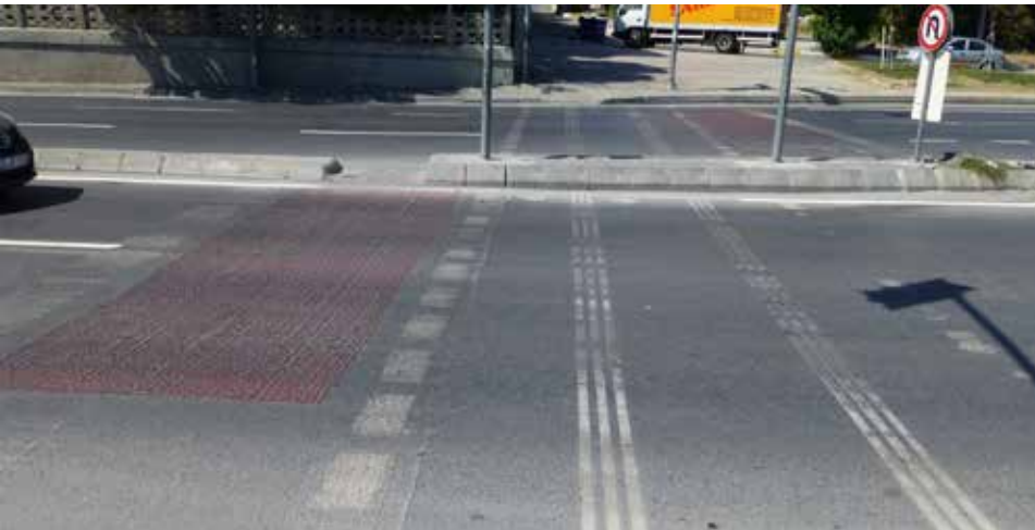
Engelliler için rampalar yaya geçidinden uzağa yerleştirilmiş