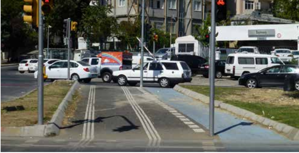
Bisiklet kullanıcıları için düğme bulunmuyor

Sorun Yaya için işaretler düğmelerle çalıştırılmaktadır ancak bisiklet kullanıcıları için düğme bulunmamaktadır.