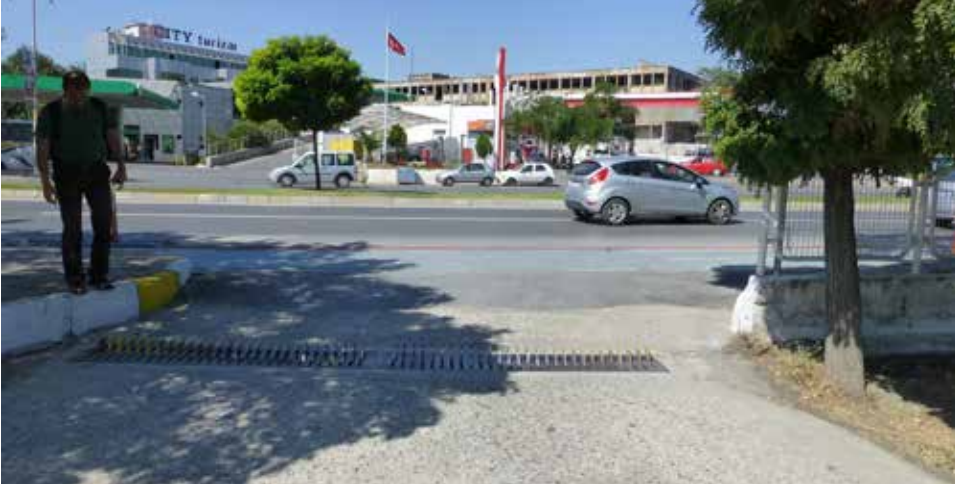
Otopark çıkışı iki yönlü bisiklet yolundan geçiyor