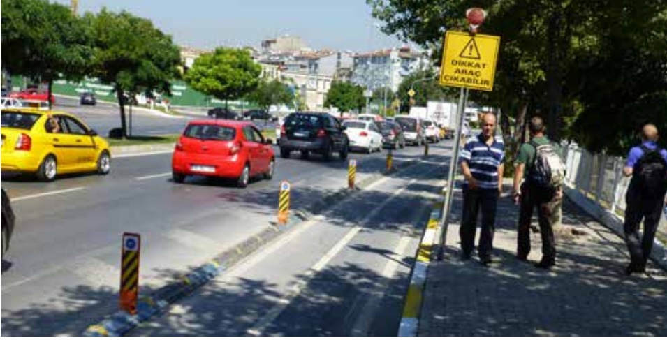
Sadece güneyden gelen bisiklet kullanıcıları için sarı uyarı ışığı