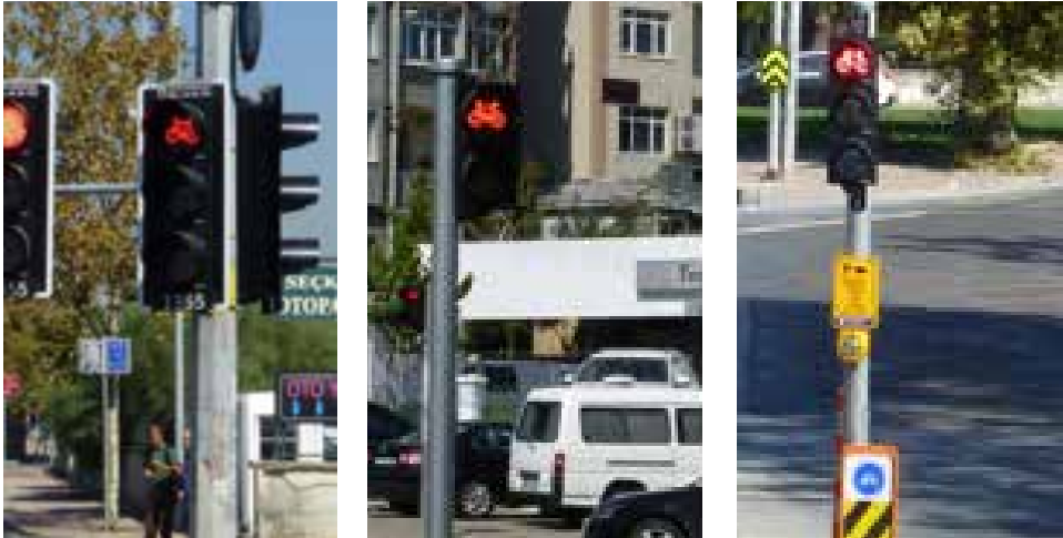
Koridor üzerinde üç farklı bisiklet sinyali kullanılıyor

Sorun - Bisikletler için üç farklı trafik sinyali kullanılmaktadır: Üç lambalı bir büyük ve bir küçük işaret ve iki lambalı bir büyük işaret. Bu şaşırtıcı olabilir. Koridor üzerindeki tüm kavşaklarda üç lambalı büyük bisiklet sinyali araçlar için kullanılan sinyal ile aynı fazda çalışmaktadır. Bu nedenle sinyal gerekli değildir. - Bisikletler için yeşil yandıktan sonra çakışan trafiğin harekete geçme süresi yaklaşık 4 saniyedir. Kavşakların çoğunda bisiklet kullanıcılarının kavşaktan çıkması için bu süre yeterli değildir.