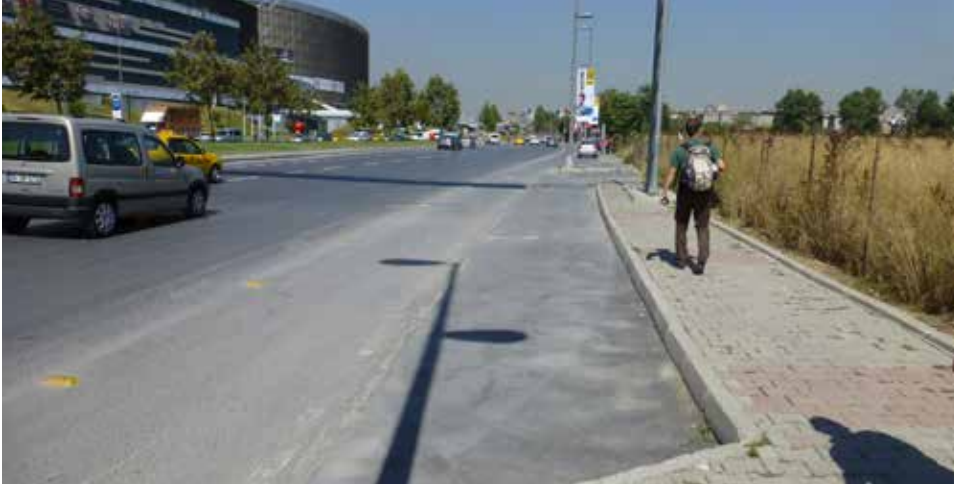
Açık yola giriş park için kullanılabilir

Sorun Yol boyunca devam eden ve henüz inşa edilmemiş bir yol bulunmaktadır, buna karşın giriş ve çıkış şeritleri oluşturulmuştur ve park alanı olarak kullanıldığı görülmüştür. Burada seyreden araçlar bisiklet yolundan geçmek durumundadır.