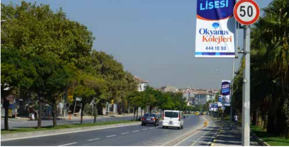
Caddenin yerleşim düzeni 50 km/saat'ten daha yüksek hızlara izin vermektedir

Sorun Yol kesitinde hız sınırı 50 km/saat'tir, fakat yol tasarımı daha yüksek hızlara izin vermektedir. Bu durum özellikle savunmasız yol kullanıcıları yolu geçmek istediklerinde sorunludur.