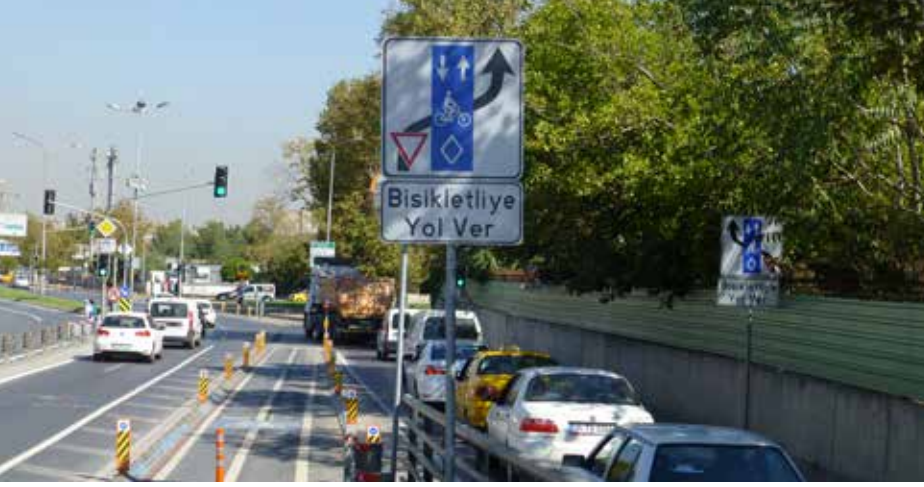
Bisiklet kullanıcıları için kavşaktaki işaretler yetersiz; dörtgen işareti net anlaşılmıyor