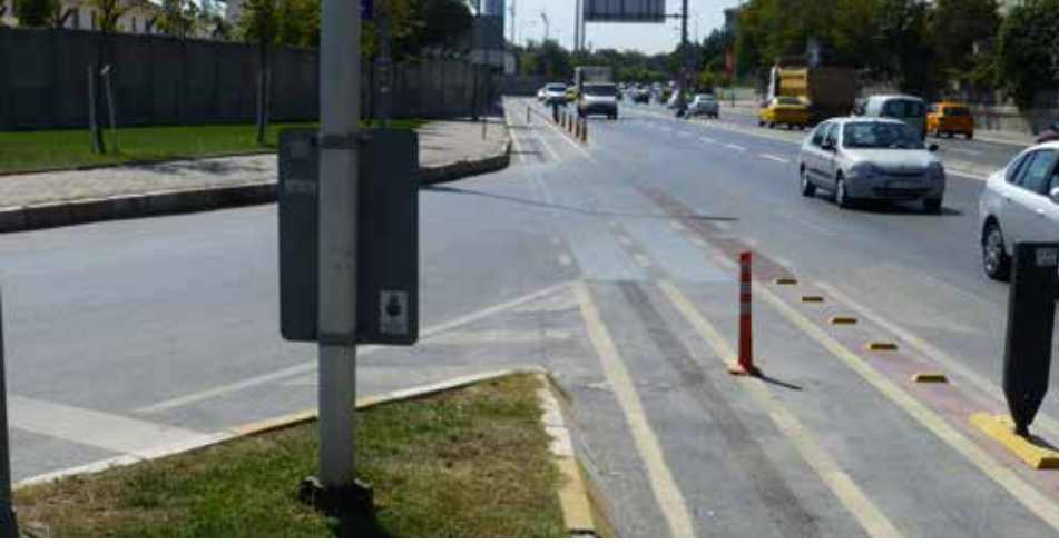
Yüksek hızlara izin veren geçiş yolu