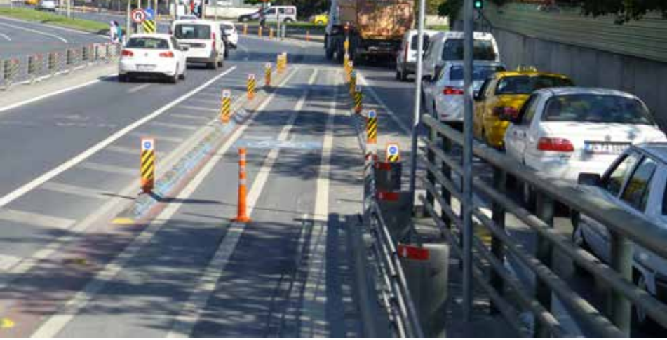
Plastik direk bisiklet kullanıcıları için tehlike oluşturuyor