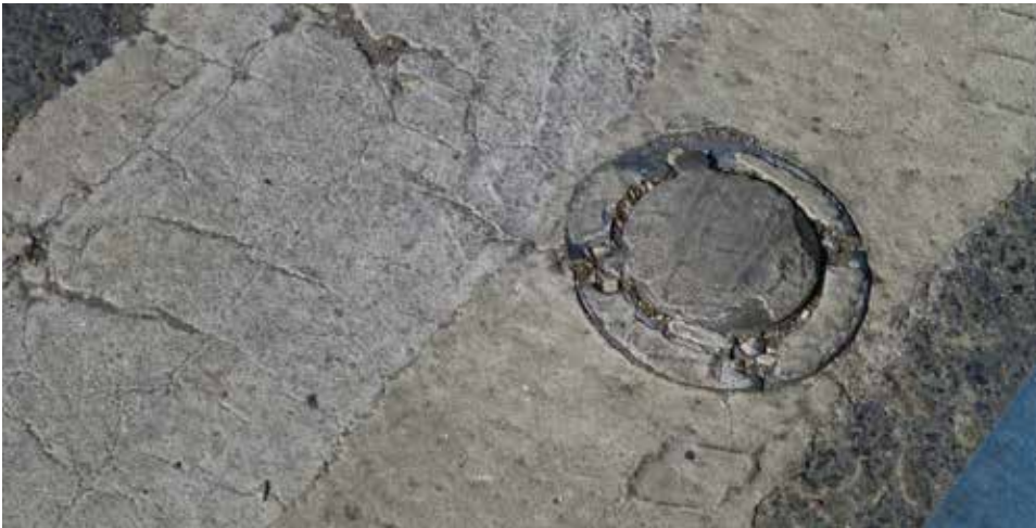
Termoplastik ile kaplanmış ışıklı yol çivileri

Sorun Köprü üzerinde bisiklet yolu boyunca dış tarafta ışıklı yol çivileri kullanılmıştır. Bu son derece doğru bir güvenlik önlemidir ancak beyaz termoplastik hat uygulandığı zaman çok sayıda çivinin üzeri kaplanmıştır.