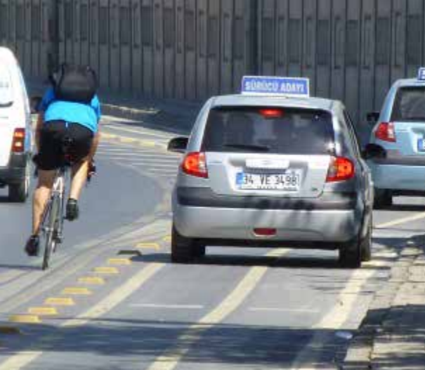
Bisiklet yolunun duran ve park eden araçlarca engellenmesi