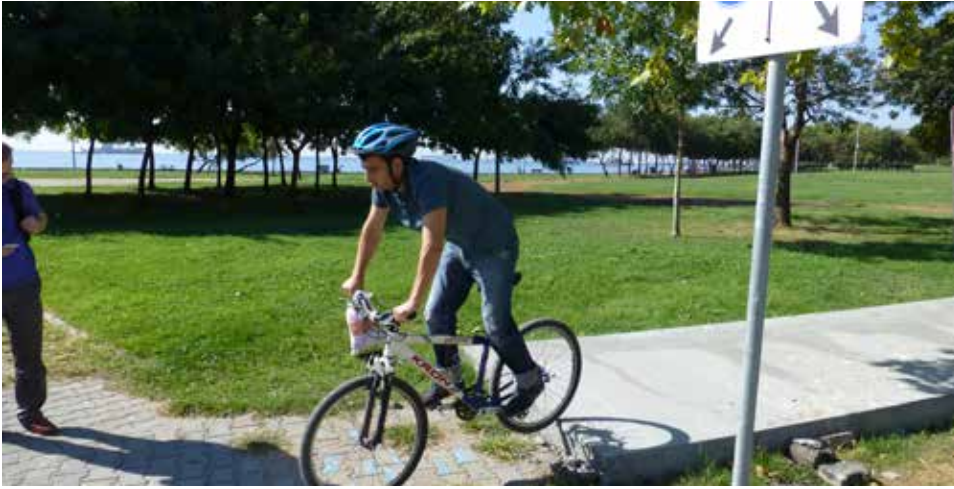
Kennedy Caddesi üzerindeki bisiklet yolu devam etmiyor

Sorun Kennedy Caddesi üzerine Aksu Caddesi üzerindeki yola bir ek inşa edilmiştir ancak yol bir anda sona ermektedir ve bunu gösteren herhangi bir işaret bulunmamaktadır. Ayrıca bu iki yol birbirine bağlı değildir, bu nedenle bisiklet kullanıcıları Kennedy Caddesi'nden Aksu Caddesi'ne geçiş yapmak için yaya yolunu kullanmak zorunda kalmaktadır.