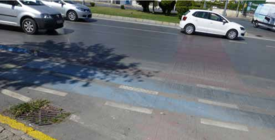
Durma çizgisi neredeyse kaybolmuş