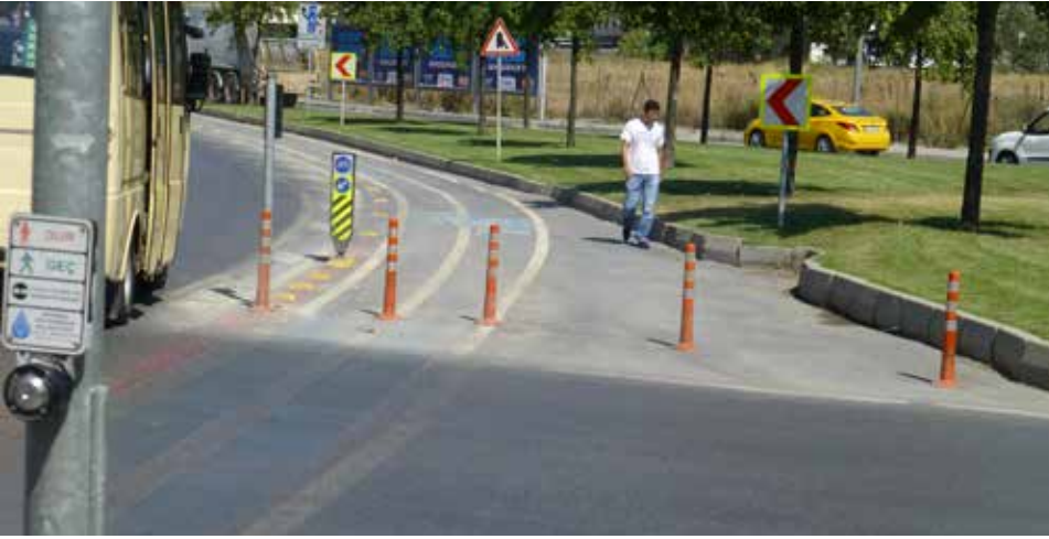
Devam etmeyen kaldırım